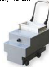
Beistellgerät, fahrbar Best.Nr.: A5800051