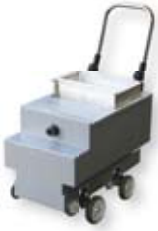
Fahrbar für Systemlabor (mit Einfahrmechanismus) Best.Nr.: A5800029