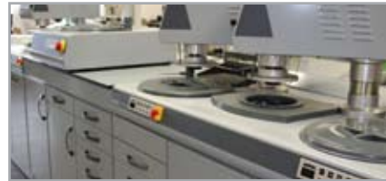
SCHLEIF- UND POLIER- KOMBINATIONEN

Ergänzend können vollautomatische Reinigungssysteme eingegliedert werden.